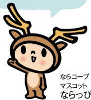
ならコープ マスコット ならっぴ

この取り組みにより年間約670万枚のラベルシールと内掛け袋が 削減され、約50トンのプラスチック容器包装削減につながります。