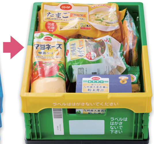
▲これからのお届け状態(袋なし)