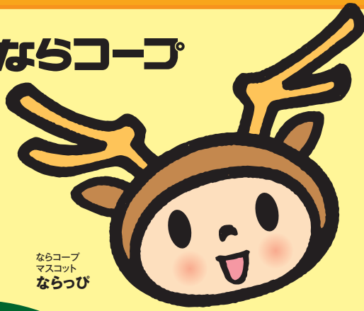
ならコープ マスクット ならっぴ