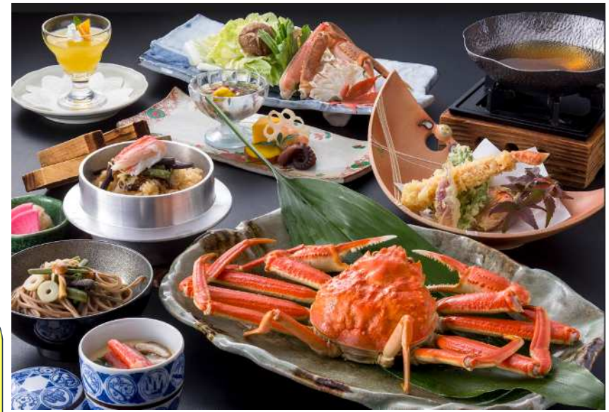
昼食イメージ