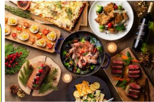
昼食イメージ