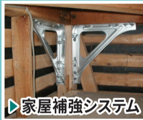
▶家屋補強システム