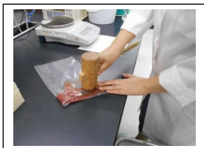
① 検体を細かくつぶす