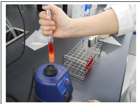
赤色の pH 指示薬を入れた試験管にお米を入れて混ぜ合わせます。

お米に含まれる主要成分のうち、タンパク質やでん粉よりも、脂質は分解が速く進みます。このことから、品質劣化の指標として脂肪酸度の測定が用いられます。脂肪酸が増えるとpHの低下を引き起こすため、pH指示薬を用いて鮮度劣化した米が混ざっていないかを確認しています。