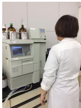
保存料検査：HPLCによる測定