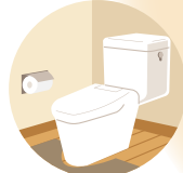
トイレリフォーム