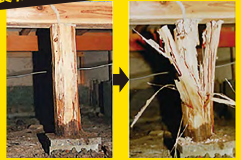
束柱の被害 内部は食われてボロボロに。