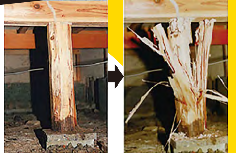
束柱の被害 内部は食われてボロボロに。