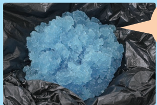
※凝固したのがわかりやすいように、水に色をつけています。