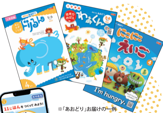
※「あおどり」お届けの一例