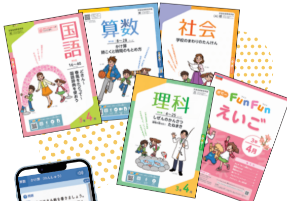
※「小学ポピー3年生」お届けの一例