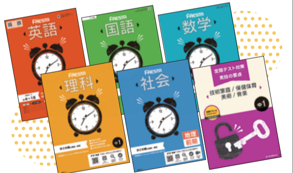
※「中学ポピー1年生」お届けの一例

紙+デジタルの学習で、忙しい中学生でも 生活スタイルに合わせて学べる! 2025年度リニューアル!