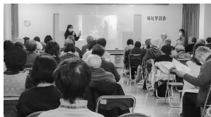
店舗1階キッズスペースで学習会のライブ映像をご覧になる皆さん