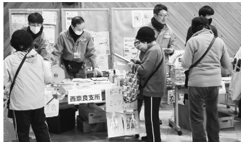
昨年の「恋の窪春まつり」の様子