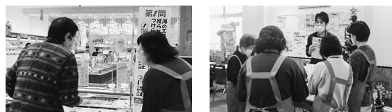
昨年の店舗での組合員のつどいの様子

組合員のつどいの詳細や参加方法は、北エリアニュース10月号、あをがき10月号、店舗掲示板で。西奈良支所主催のつどいは、共同購入・こまどり便・受取ハウスで配布するチラシをご覧ください。