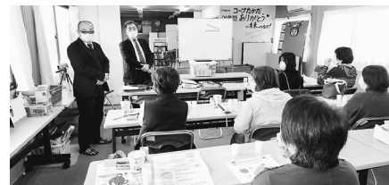
昨年の組合員のつどい「高田東コープ委員会」