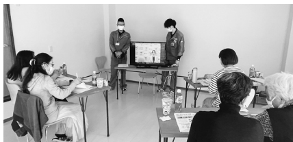
昨年の組合員のつどい「榎原東コープ委員会」

組合員のつどいの詳細や参加方法は、南エリアニュース今月号・10月号、あをがき10月号、店舗掲示板、ならコープホームページなどでお知らせします。みなさまのご参加をお待ちしております。