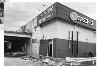
竜田川センター（右写真）は配達の拠点になります