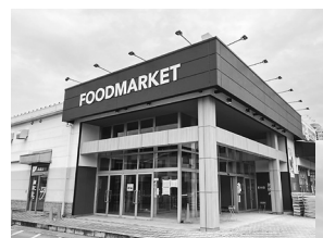
コープたつたがわ（左写真）には直営ベーカリーを新設します

ディアーズコープたつたがわは、改装を機に名称を「コープたつたがわ」に変更し、装いを新たにオープンします。店舗隣には、配達拠点となる竜田川センター（10月に事業開始予定）を併設し、地域のみなさまのくらしを支えます。