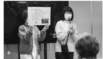
奈良県医療福祉生協の健康講座♪

今後も地域の一員として、地域の皆さんと顔と顔の見えるつながりを大切に、信頼関係を築いていきたいと思っております。(福祉・子育て担当理事)