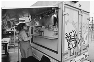
ならっぴキッチンカー

主催者、関連団体によるバザーや農産物の販売・輪投げ・健康チェック(血圧・体脂肪・骨密度)・雑貨の販売・青空クイックマッサージなどのブース