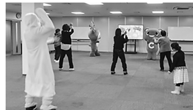
コーすけ・ならっぴとLet'sダンス

今後も地域の一員として、地域の皆さんと顔と顔の見えるつながりを大切に、信頼関係を築いていきたいと思っております。(福祉・子育て担当理事)