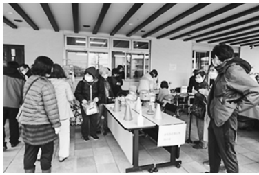
輪投げ、健康チェック、イチゴや雑貨の販売

2016年春に「あすならハイッ恋の逢」開所以来、桜咲くこの季節に、地域の皆さんとの交流を目的に毎年開催していましたが、2020年から新型コロナウイルス感染防止のため中止していました。