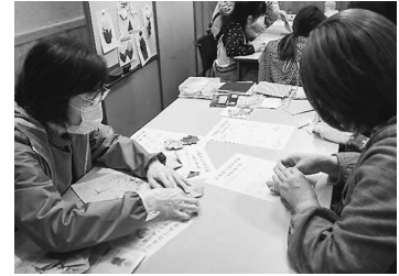
折り紙ボランティア