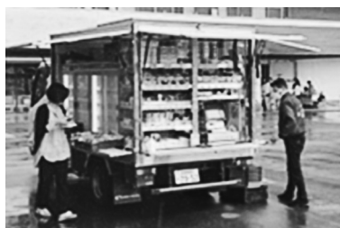
コープあったか便移動店舗

出店。“ならっぴキッチンカー”からコープ商品の試食提供。コープあったか便移動店舗でお買い物もできました。