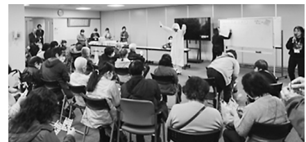
ビンゴゲームで大盛り上がり！