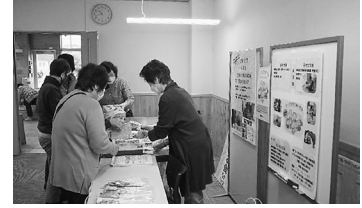
コープたすけあいの会

折り紙ボランティアによる「折り紙教室」や、なら消費者ねっこの紹介ブース、「ちびっこ集まれ！コーすけ・ならっぴとLet'sダンス」、奈良県医療福祉生協による健康講座・健康体操、ならコープ主催のビンゴゲームでは大いに盛り上がりました。久しぶりに、たくさんの笑顔に出会い、楽しい一日となりました♪