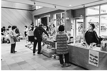
バザーや農産物の販売

3月26日(日)ならコープ本部で、恋の逢春運営協議会(社会福祉法人協同福祉会、奈良県医療福祉生協、ならコープ)主催による「恋の逢春まつり2023」を開催しました。