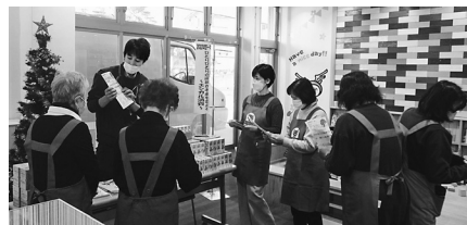
Dコープいこま店舗活動グループ