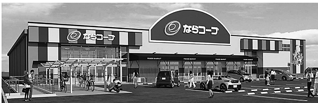
2021年2月リニューアルオープン