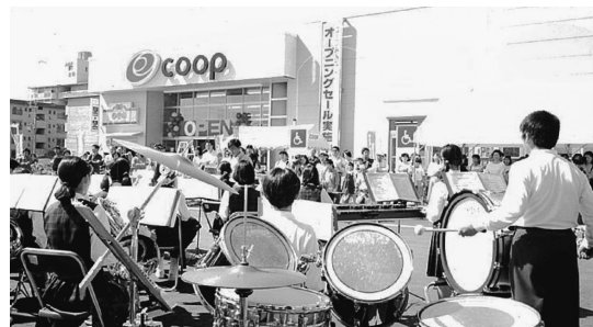
1996年10月移転オープン