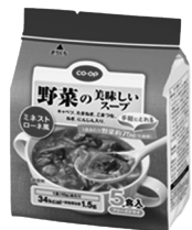
ミネストローネ風

フリーズドライでシャキシャキ野菜がたっぷり入ったスープです。3種類の味があります。