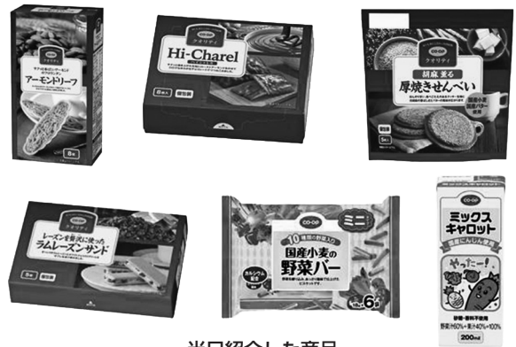
当日紹介した商品