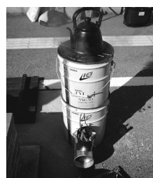
完成したロケットストーブ

最後に、“かまどベンチ”に火を入れての炊き出しでは、コープなんごうで活動する自主活動グループ“なんご