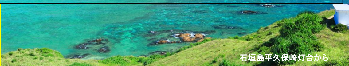
石垣島平久保崎灯台から