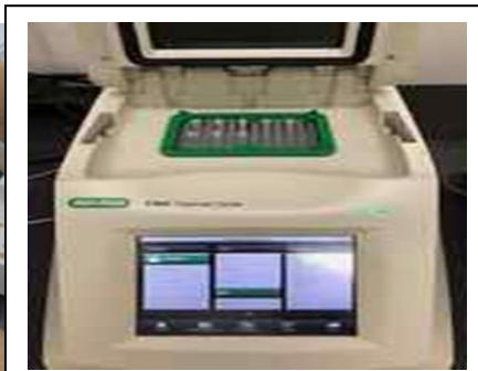
抽出した遺伝子を増幅