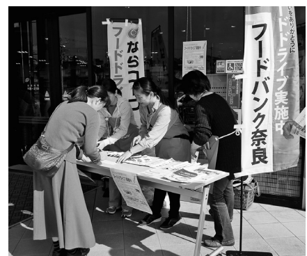
コープなんごうでのフードライブのようす

他に、家庭で余っている、使いきれない食品を持ち寄り、フードバンク奈良を通じて、食品を必要とされてい