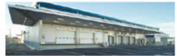
田原本物流センター

入荷から集品、出荷までの品質管理を強化し、多様化する組合員のニーズに対応する機能を備えた低温センターが完成しました。入荷時に外気と害虫の侵入を防ぐとともに、入選管理システムを導入し、防犯セキュリティを向上させ、商品管理を強化した新施設です。施設を見学した組合員からは「温度管理や商品管理が徹底されていて安心して利用できます」との感想が寄せられています。