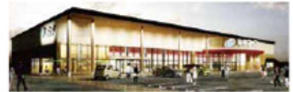
コープなんごう(完成予定図)

コープなんごうは「毎日のおかずとその食材が安心して楽しく買える店」の実現をめざしています。「よりおいしい」の提供をめざし、店内の素材を使った家庭の味、誰もが食べたいと思える商品、買いやすい価格・量目の提供、コープならではの商品の開発をすすめます。未来へ続く拠点づくりとして地域の方々が気軽に集える場所、話ができる場所として地域になくてはならない店舗となるように組合員とともに取り組んでいます。