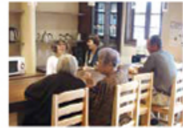
あすならハイツ窓の産 喫茶スペース

社会福祉法人協同福祉会・奈良県医療福祉生協・コープたすけあいの会と協力しながら困った時の心の拠り所となるように組合員や地域住民が気軽に相談や立ち寄りができる、学びやつながりができるように取り組んでいます。奈良県や市など行政の福祉窓口との関係づくりをすすめ地域住民とともに地域社会づくりをすすめます。施設では、足湯、サロン、喫茶などもあり地域の方々がつどえ、くらしや介護について相談もできます。