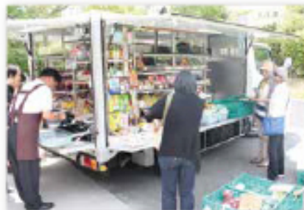
移動店舗車を組合員のつどい実行委員会で見学!

「牛乳や生鮮商品が買えるので便利ね!」「買い物が不便なので楽しみにまっています。」との声をいただいています。